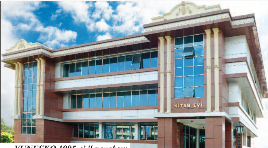
YUNESKO 1995-ci il noyabrın 15-də Parisdə keçirilən 28-ci sessiyasında hər il aprel ayının 23-nü Ümumdünya Kitap və Müəllif Hüquqları Günü elan etmişdir.

Kitap çapının meydana gəlməsindən bu günümüzdək neçə əsrdür ki, kitab mənəvi və aqlı sərvətlərimizin nəsil-dən-nəslə ötürülməsində əvəzsiz rol oynamaqdadır. Orta əsrlərdə Azərbaycan şairləri əsərlərinin sonunda əsl adı və poetik ləqəbi işlətməklə müəlliflik hüququnun səmərəli qorunma formasından istifadə etmişlər.